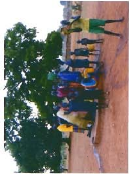
immagine del pozzo

Specificando nella causale "Pozzo Gussago/Aliap"